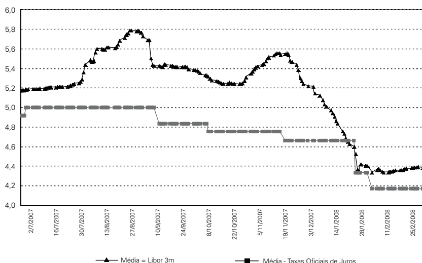
Gráfico 2 Taxa do Mercado Interbancário 1 e Taxas Oficiais de Juros 2 — %